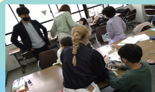
小学生たちと遊びに勉強に大忙しの「ふじらぼ」の若者・大学生たち。そこに寺子屋の中学生も参加をはじめました。4/17 青少年会館